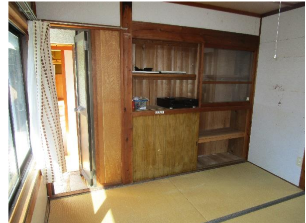
1F 和室 4.5 (別棟)