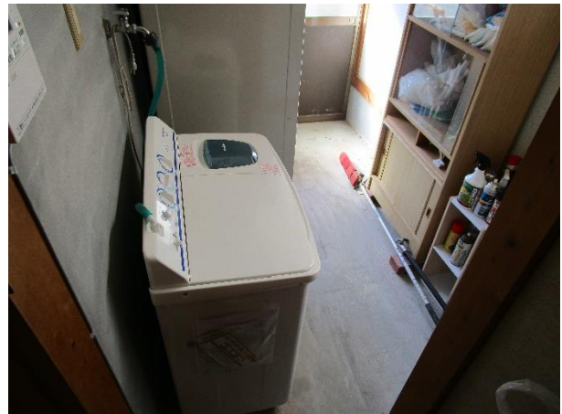
1階 物置・洗濯機置き場