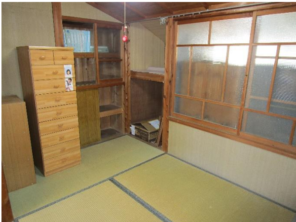
1階 和室 3 (別棟)