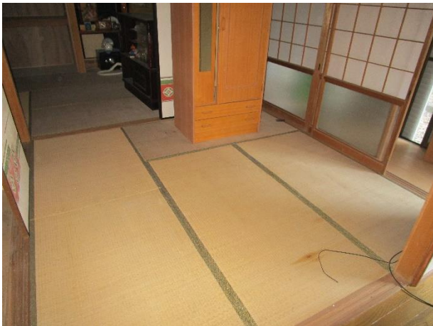
1階 和室 4.5