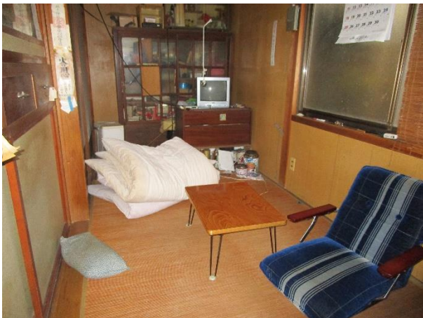
1階 和室 4