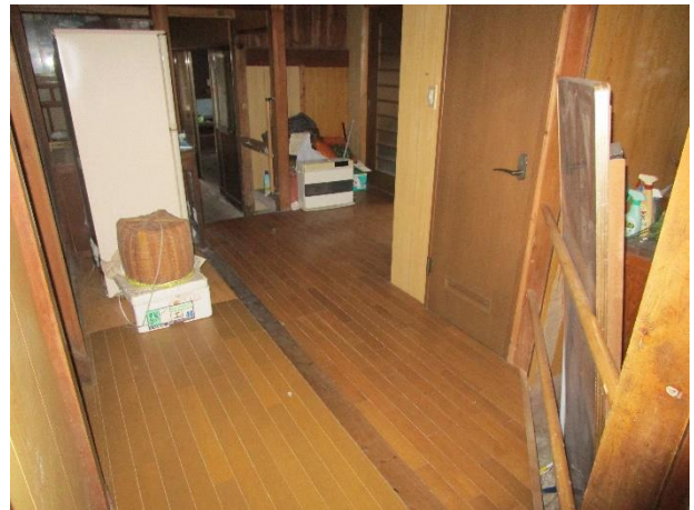
1階 廊下 (階段前)