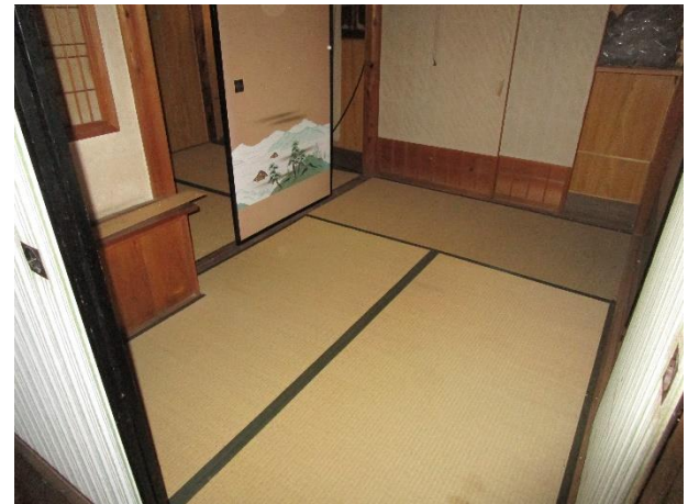
2階 和室 3