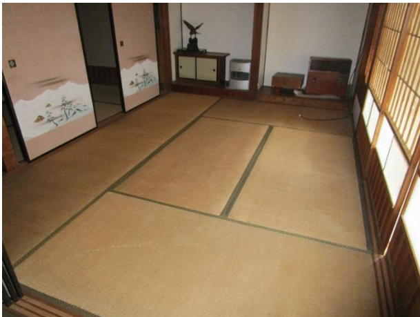
2階 和室 6