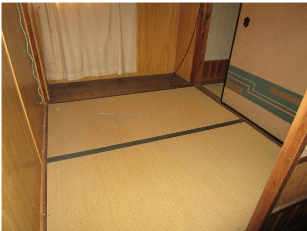
2階 和室 2