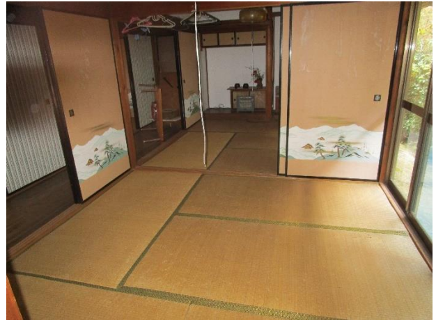
2階 和室 4.5