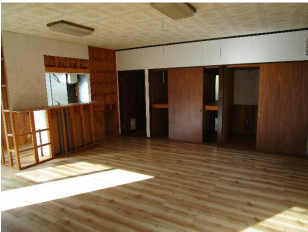
2 F ダイニングキッチン