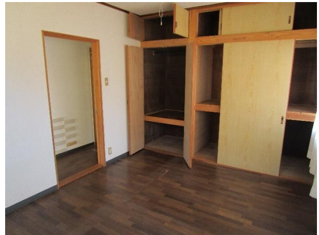
1階 洋間 (玄関横)